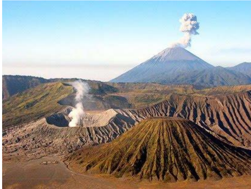
Gambar 1. Bentuklahan asal proses vulkanik (kaldera)