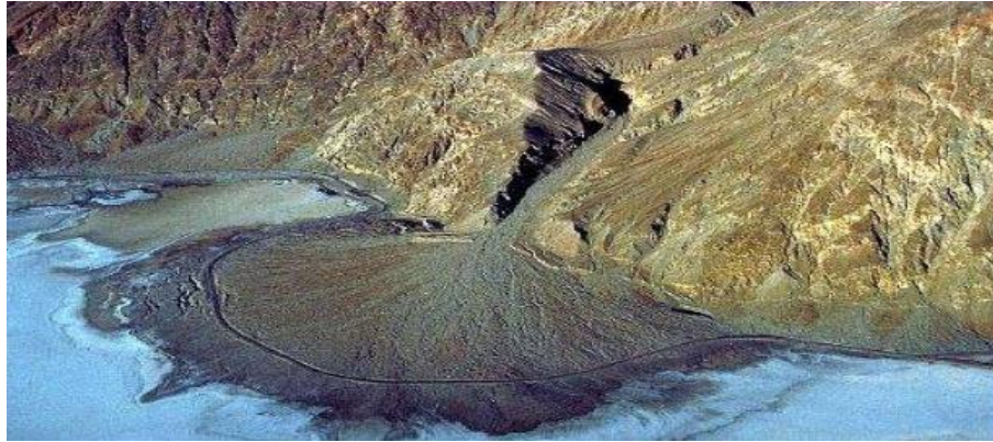
Gambar 3. Bentuklahan asal fluvial berupa Kipas Aluvial