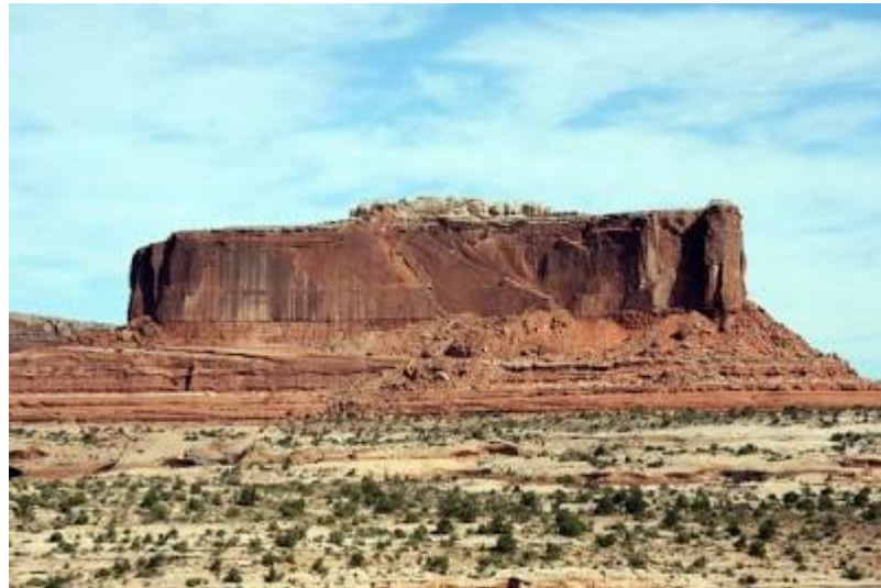
Gambar 5. Bentuklahan asal proses Denudasional (Bukit Sisa)

erosi. Contoh satuan bentuklahan ini antara lain: bukit sisa, lembah sungai, peneplain, dan tanah rusak.