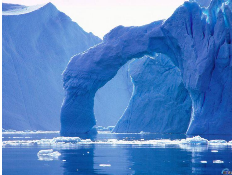
Gambar 8. Bentuk lahan asal proses Glasial