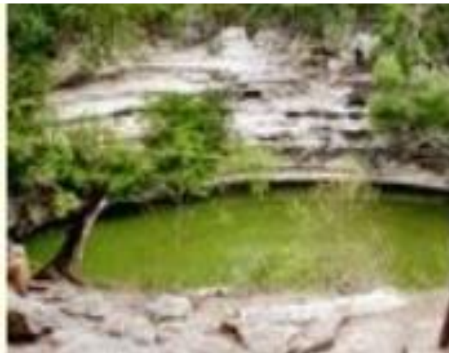
Gambar 4. Bentuklahan asal proses Solusional