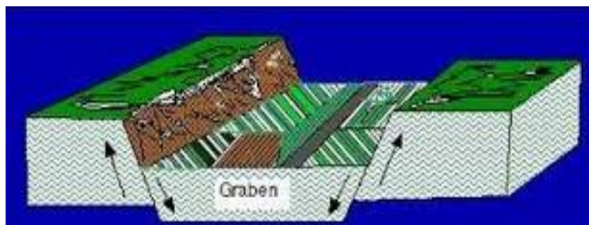
Gambar 2. Bentuklahan asal proses struktural (Graben)