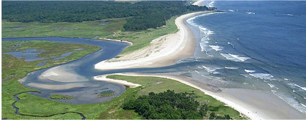
Gambar 7. Bentuklahan asal proses marine (Estuaria)

kebanyakan sungai dapat dikatakan bermuara ke laut, maka seringkali terjadi bentuk lahan yang terjadi akibat kombinasi proses fluvial dan proses marine. Kombinasi ini disebut proses fluvio-marine. Contoh-contoh satuan bentuklahan yang terjadi akibat proses fluvio marine ini antara lain delta dan estuari.